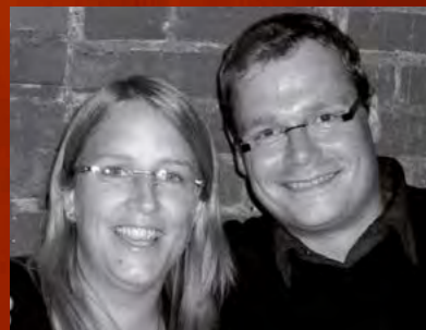
Illustration: Rolf Vogt AR.VI