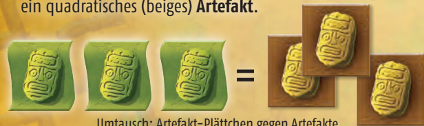
Umtausch: Artefakt-Plättchen gegen Artefakte