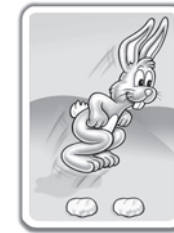
2 Felder vorwärts