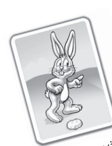
1 Feld vorwärts

Wenn du eine Karte mit einem Hasen aufdeckst, läufst du mit einem deiner Hasen so viele Felder den Hügel hinauf, wie unten auf der Karte zu sehen sind.