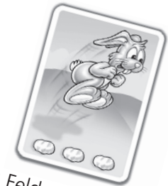
3 Felder vorwärts