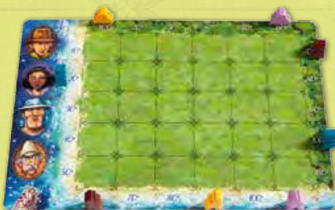
So könnten eure Inseln vor Spielbeginn aussehen.