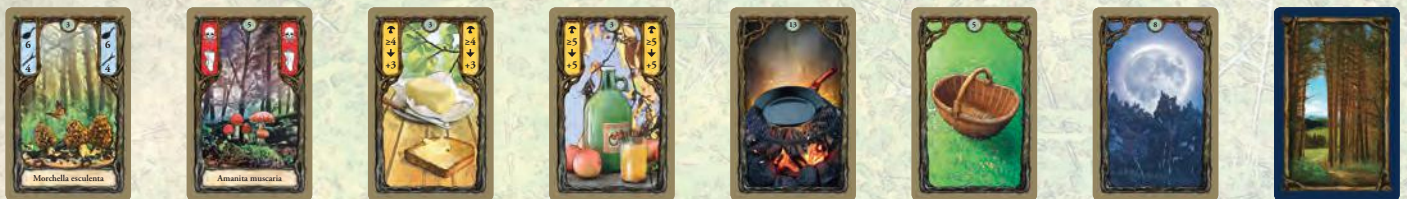
Speisemorchel Fliegenpilz Butter Cidre Pfanne Korb Mond Rückseite