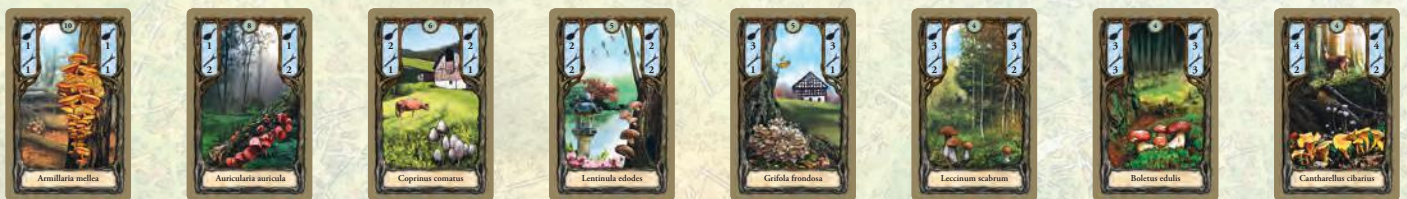
Hallimasch Judasohr Schopf-Tintling Shiitake Klapperschwamm Birkenpilz Herrenpilz Pfifferling