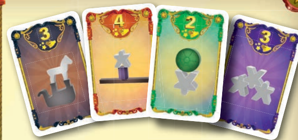
Beispiele für Zuschauerwünsche