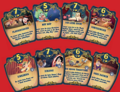
Beispiele für spaßige und technische Darbietungsplättchen