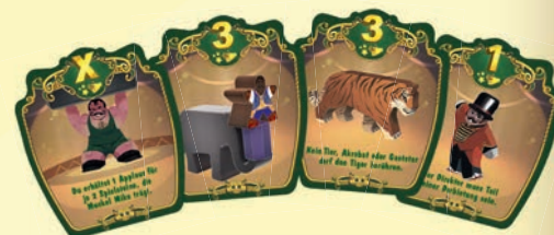
Beispiele für Gaststars

Du erhältst Applaus für den Gaststar entsprechend der Zahl auf seinem Plättchen, wenn du die gezeigte oder beschriebene Darbietung erfüllst.