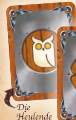
Die Heulende Eule