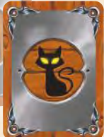
Zur Schwarzen Katze