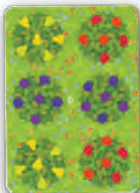
Erste Karte im Obsthain